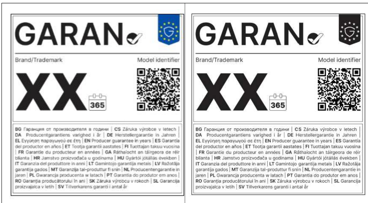
[그림 2] 상업적 내구성 보증 라벨의 디자인 및 내용