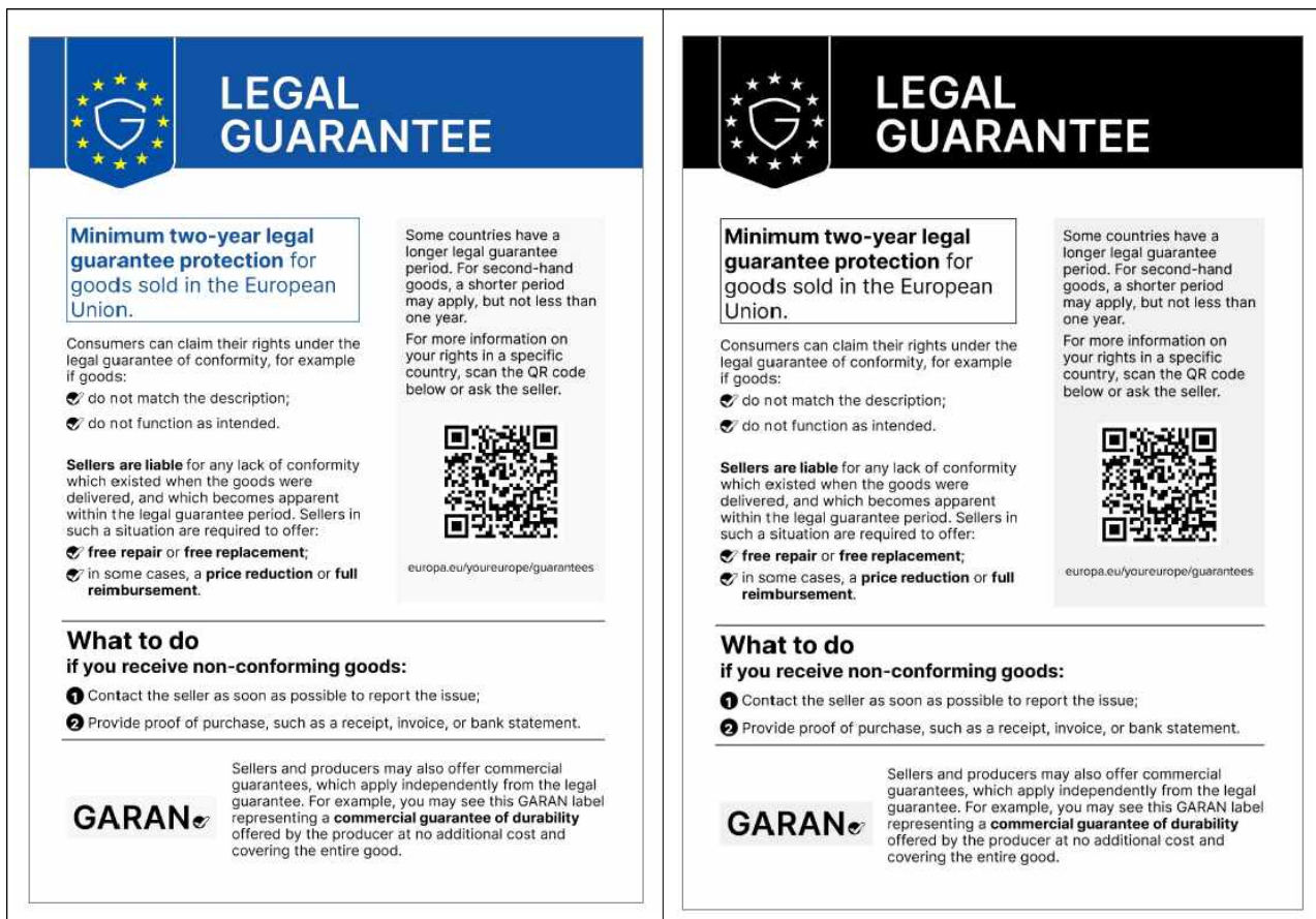
[그림 1] 법적 적합성 보증 공지의 디자인과 내용