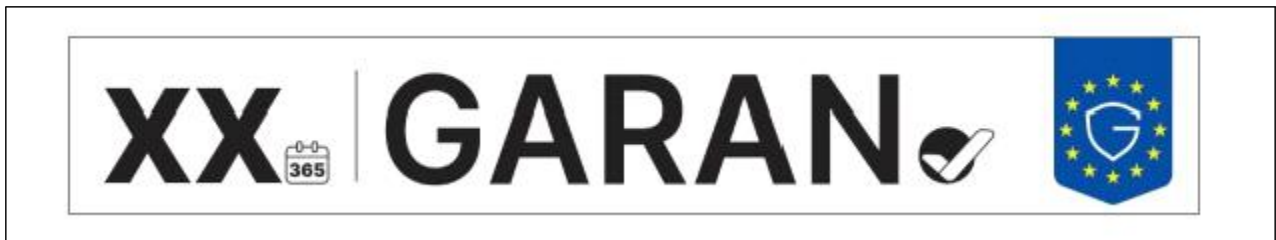
[그림 4] 상업적 내구성 보증 라벨의 중첩된 디스플레이